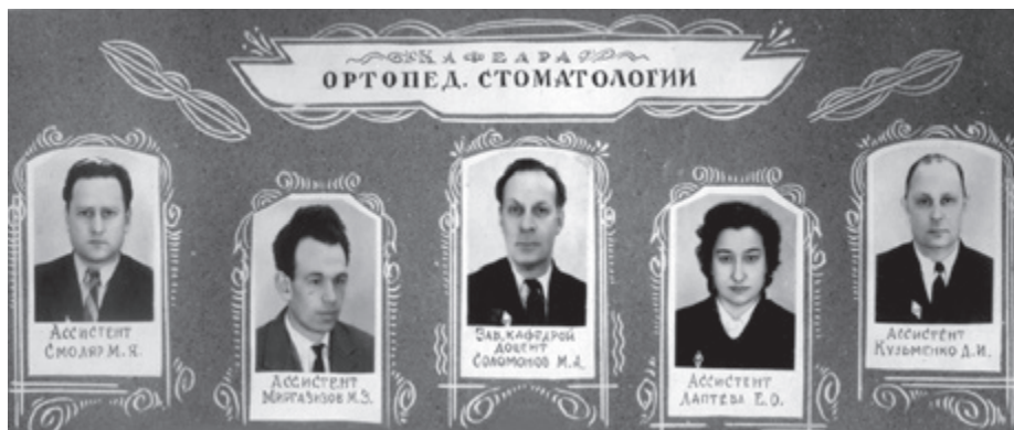
Первый коллектив кафедры ортопедической стоматологии КГМИ, 1960 год.