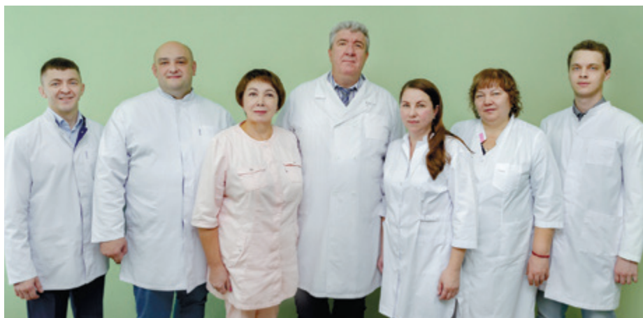
Коллектив кафедры хирургической стоматологии и ЧЛХ, 2023 год.

ности иммуномодулирующей терапии как средства профилактики хронического одонтогенного остеомиелита.