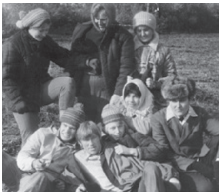
На картошке (1975 г.)

Я могу с уверенностью сказать, что годы студенчества действительно были самыми продуктивными, активными и интересными. Ну, а друзья, появившиеся в студенческие годы, – это друзья на всю жизнь. Мы до сих пор раз в пять лет встречаемся, общаемся, помогаем друг другу и,